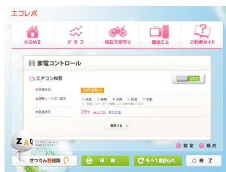
▲家電コントロール画面 (サンプル)