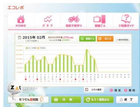
▲電力使用量画面 (サンプル)