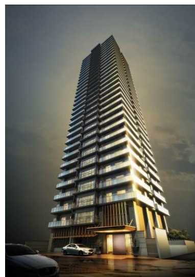
ファインシティ札幌ザ・タワー大通公園 完成予想パース