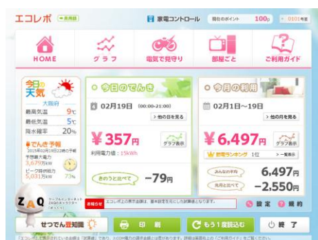
▲エコレポ TOP 画面 (サンプル)