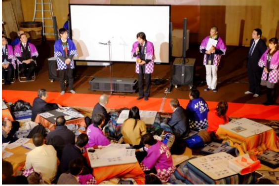
表彰を受ける札幌メディアセンターの制作担当者