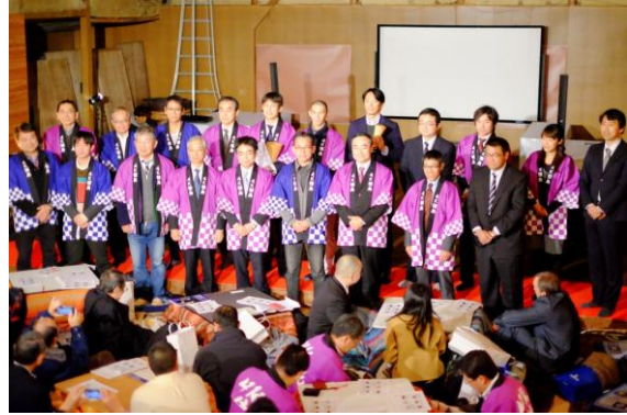
贈賞式の様子 12月5日、寄井座(徳島県)にて