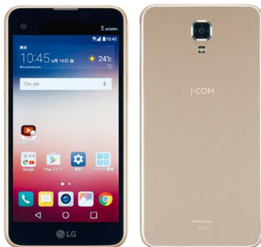
2016年8月18日より販売開始 日本初登場の「LG X screen」(イメージ) 画像はシャンパンゴールド

株式会社ジュピターテレコム(J:COM、本社:東京都千代田区、代表取締役社長:牧 俊夫)は2016年8月18日より、モバイルサービス「J:COM MOBILE」(ジェイコムモバイル)の新端末を全国のJ:COMエリア*1で販売します。新たにラインアップに加わる端末は、日本初上陸の「LG X screen」(LG Electronics製)です。今後お客さまは、「J:COM MOBILE スマホセット [3GB]」(月額基本料金2,980円(税抜)*2)をご契約の際に、J:COMオリジナルの端末「LG Wine Smart(LGS01)」(LG Electronics製)、「富士通 arrows M02」(富士通製)、「LG X screen」(LG Electronics製)の3端末からいずれかを選択できるようになります。