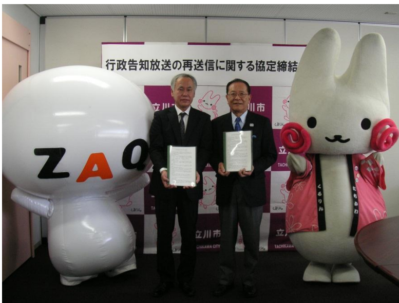
1月18日締結式の様子