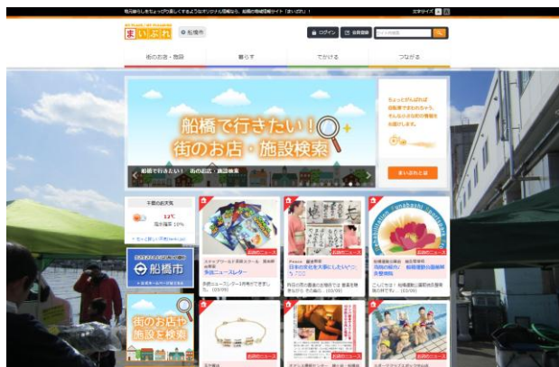
【まいぷれ船橋 イメージ】