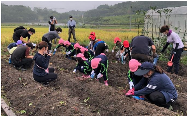
<10月13日 さつまいもの日に収穫>