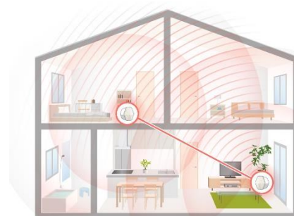
<メッシュの広がリイメージ>

AIが、Wi-Fi利用状況を分析し常に最適なWi-Fi環境を自動構築します。デバイスの特性、利用状況、周囲の環境変化に合わせて、2.4GHz帯と5GHz帯から最適な帯域に自動で接続します。煩わしい設定や操作をせずとも、途切れることなくWi-Fi利用が可能となります。