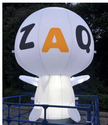
<特設ブースイメージ>

ジェイコム千葉がジェフユナイテッド市原・千葉でのマッチデーを開催するのは、今回が初めての取り組みです。J:COMのCMでもおなじみのキャラクター「ざっくう」の大きなエア看板が出迎える会場の特設ブースでは、全選手のサイン入りユニフォームやざっくうグッズが当たるプレゼントキャンペーン、ざっくうのグリーティングなどを実施します。