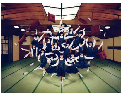
<アバンギャルディ>