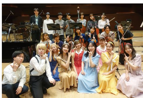
<J-POP CLASSIC CLUB TOKYO>