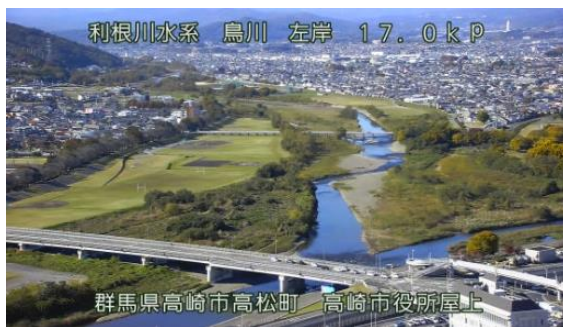
「J:COM チャンネル」河川映像使用イメージ

株式会社ジェイコム埼玉・東日本(J:COM、本社:埼玉県さいたま市、代表取締役社長:平岩光現)は、高崎市内の河川カメラ映像を、2024年12月16日(月)より「J:COMチャンネル群馬」(地デジ11ch)で放送、また地域情報アプリ「ど・ろーかる」(以下、「ど・ろーかる」)でも配信を開始します。