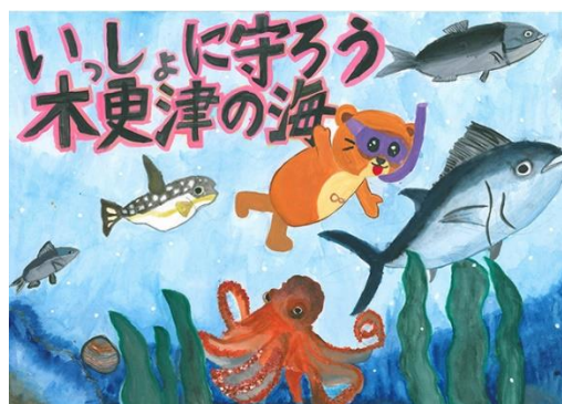
<「海上自衛隊航空補給処長賞」受賞作品>

J:COM 木更津は、ゴミのポイ捨てを抑止するマナー向上の啓発活動として、木更津市内の小学校を対象にポスターデザインコンテストを2016年から開催しています。