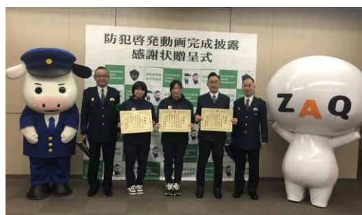
<2月3日贈呈式の様子>