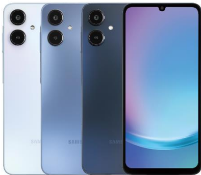
Samsung Galaxy A25 5G端末イメージ

JCOM株式会社(J:COM、本社:東京都千代田区、代表取締役社長:岩木 陽一)は、モバイルサービス「J:COM MOBILE」の新たなラインナップとして、Samsung Galaxy A20シリーズの新機種「Samsung Galaxy A25 5G」を、2月27日(木)より販売開始します。