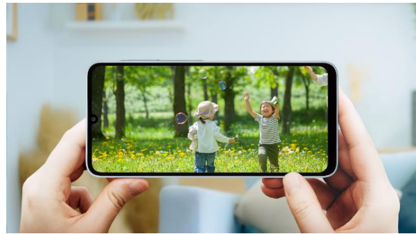
約6.7インチの大画面イメージ