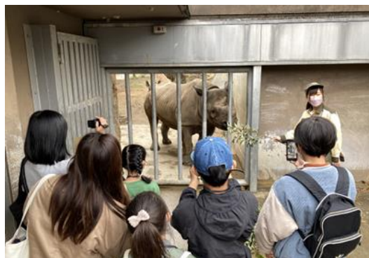
<イベントイメージ(前回開催時の様子)>

本イベントは、関西全域のコミュニティチャンネル「J:COMチャンネル」(地デジ11ch)で放送中の、天王寺動物園応援番組『てんのうじどうぶつえんのZOOっとテレビ』のスペシャル企画です。番組がめざす「いのちの尊さ」「地球環境の保全」について考えるきっかけづくりの場を、動物園の中で提供します。「ひとつにも動物にもやさしい1日に」をイベントテーマに、イベント参加者がSDGsに取り組むきっかけになることを目指しています。