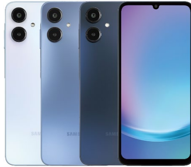
Samsung Galaxy A25 5G端末イメージ

JCOM株式会社(J:COM、本社:東京都千代田区、代表取締役社長:岩木 陽一)は、法人向けモバイルサービス「J:COM MOBILE BUSINESS」の新たなラインナップとして、「Samsung Galaxy A25 5G」(以下、本端末)を、2025年3月18日(火)より提供開始します。