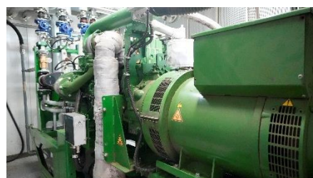
＜発生したガスにより発電機を運転、発電＞

J:COMは、需要家として再生可能エネルギーへの切り替え、放送・通信設備やオフィスにおける省エネルギー施策を推進し、また電力卸売事業者としてグリーンメニューの拡充やお客さま宅における太陽光発電・蓄電に取り組み、事業を通じた社会課題の解決と持続可能な社会の実現に貢献してまいります。