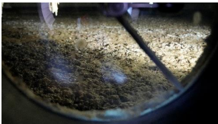
＜堆肥を約40日間発酵させることでメタンガスを生成＞

北海道エリアでは、バイオガス発電によるフィジカルPPAを2026年4月より導入して、地域に根差した再生可能エネルギーの地産地消モデルを構築しました。バイオガス発電は、堆肥の臭害対策や液肥へのリサイクルにも貢献する資源循環型の発電方法です。地域の資源と余剰電力を都市部で有効に活用することで、持続可能なエネルギー循環に貢献しています。発電した電力は、札幌市内のヘッドエンドを中心に利用しています。