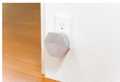
<ZAQ メッシュ Wi-Fi 機器>