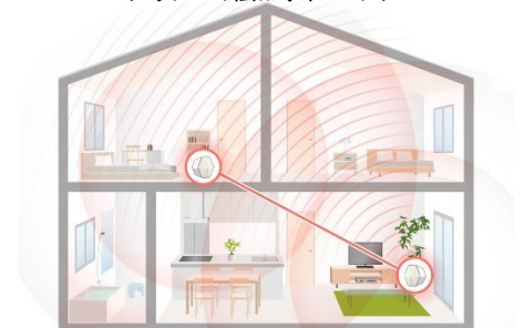
<メッシュの広がりのイメージ>

J:COM がケーブルテレビ事業者へ提供する Wi-Fi 機器を 2 台以上設置することで一般的な Wi-Fi ルーターでは届きにくかった広範囲で安定した接続が可能となります。接続が不安定になりやすかったお風呂場、玄関、寝室など、機器から離れた場所においても、安定した Wi-Fi 環境が実現できます。