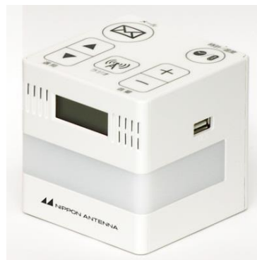
「防災情報サービス」端末の参考写真

J:COMでは、これからも地域と連携し地域災害への備えに力を入れるとともに、さらなる安全・安心のまちづくりに取り組んでまいります。