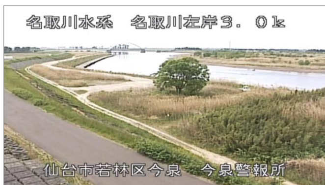
「J:COM チャンネル」 河川映像使用イメージ

J:COM では、コミュニティチャンネルの特長を活かし、より身近な地域の防災情報を皆さまにお届けするとともに、安全・安心なまちづくりに貢献してまいります。