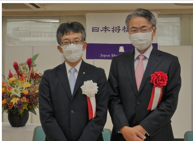
<第47回「将棋の日」表彰・感謝の式典の様子>

子ども将棋大会の開催、奨励会への支援、 「J:COM 賞」の創設を通じて、将棋の普及振興に貢献