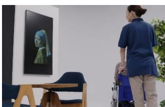
施設の憩いの場に