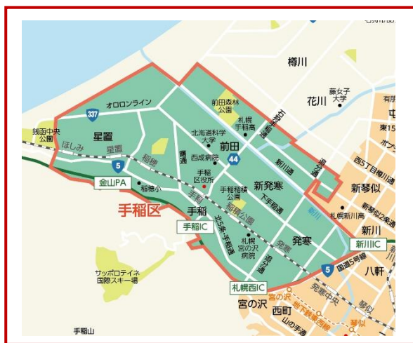
《今回の延伸エリア》

また、J:COM のネットワークが敷設されているエリア・建物には、J:COM のコミュニティチャンネル「J:COM チャンネル札幌」(地上デジタル11ch)を無料で放送しており、新規エリアの皆さまは2023年1月以降、行政情報・防災情報・交通情報などの様々な地域情報をご覧いただけるようになります。