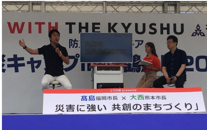
9月3日「防災キャンプ in 舞鶴公園 2017」での対談の様子