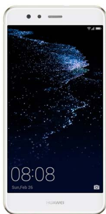
「HUAWEI P10 lite」(パールホワイト)