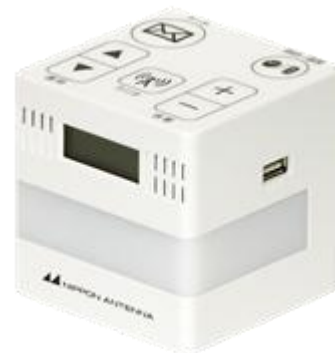
J:COMの 防災情報サービス 端末

本サービスの開始により、海老名市にお住まいでJ:COMの「防災情報サービス」に加入されているご家庭では、高層マンションや気密性の高い住宅でも防災行政情報を明瞭に聞くことができるようになります。