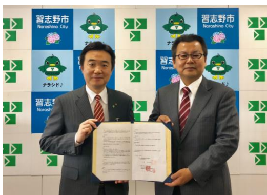
<宮本習志野市長(左)と京 YY 船橋習志野局長(右)>