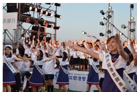
※写真は、昨年の様子です

横浜市ケーブルテレビ協議会傘下のケーブルテレビ会社 5 社で組織する制作委員会は、2018 年 6 月 1 日(金)、6 月 2 日(土)の 2 日間、みなとみらい 21 地区、新港地区、その他周辺会場で開催される「第 37 回横浜開港祭」の様態を特別番組として制作し、6 月 2 日(土)17 時から神奈川県ケーブルテレビ協議会傘下のケーブルテレビ会社 8 社のコミュニティチャンネルで生放送いたします。また、J:COM が提供する地域情報アプリ「ど・ろーかる」でもライブ配信*を行いますので、スマートフォンやタブレットで、全国どこでもご視聴いただけます。