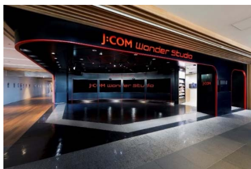
<J:COM Wonder Studio>