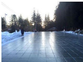
<日光の天然水と尽力によって作られる“日光天然の氷 四代目徳次郎”>

大正時代から続く老舗氷室「日光四代目徳次郎」の天然氷を使用したかき氷は、綿あめのようなフワフワな触感と、一気食いをしてもキーンとしない特徴があります。その天然氷の繊細な食感を損ねることのない自然派「和素材」シロップでご堪能いただける氷菓処にじいろのかき氷は奇をてらわずにシンプルな奥深い味わいです。古くは平安貴族も食した天然氷。2018夏、イチオシのかき氷です。