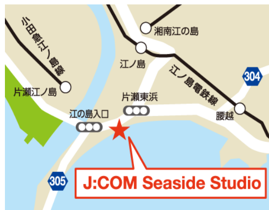
「J:COM Seaside Studio」は江の島を望む絶好のポジションに立地