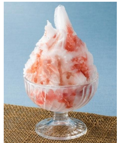
<氷菓処にじいろの“天然氷のかき氷”>