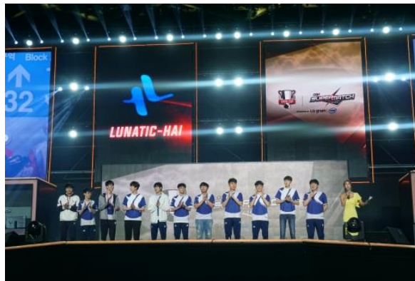
写真は昨年の国際大会の様子

e スポーツの海外市場規模は 700.9 億円、視聴者数は 3 億 3500 万人(ともに 2017 年)と言われており、2018 年にはその市場規模は 38.2%、視聴者数は 13.8%に成長すると予想されています。一方、2017 年の日本国内の市場規模は 5 億円未満、視聴者数も 158 万人に留まるものの、関心も高まりつつあり、今後の市場拡大に大きな期待が寄せられています。