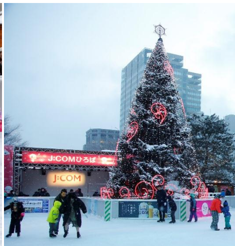
＜「J:COM ひろば」内スケートリンク＞