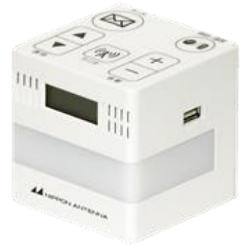
J:COMの 防災情報サービス 端末

「防災情報サービス」は、気象庁が発報する緊急地震速報と自治体が配信する防災行政無線の放送内容を専用端末により提供するサービスです。また、この端末にはFMラジオが搭載されており、災害時には持ち出してFMラジオを受信することもできます。