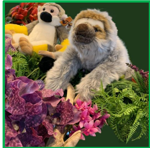
ぬいぐるみ展示イメージ