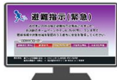
テレビ画面に表示する情報のイメージ