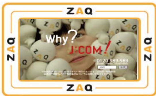
<「ざっくう CM ライブラリー」>