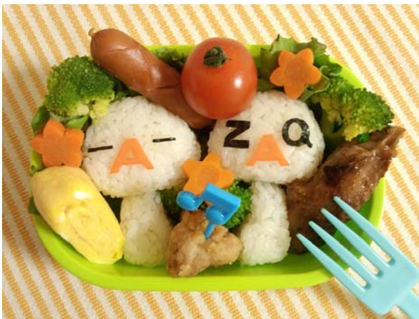
<「ざっくぅ」をモチーフにしたお弁当(例)>