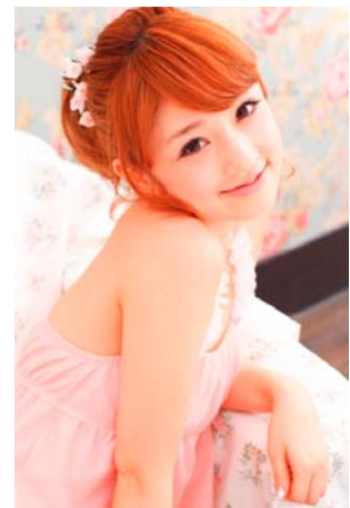
<審査員:小倉優子さん>