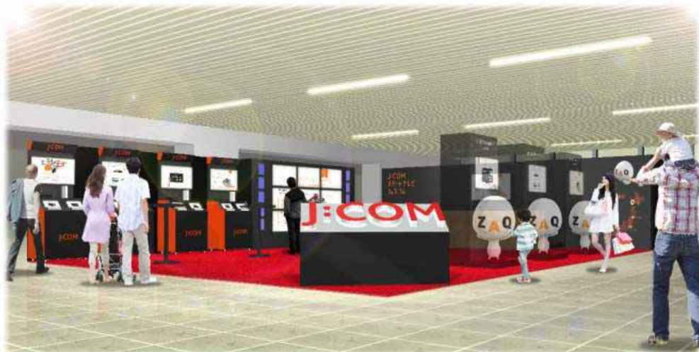
札幌会場イメージ

イベント会場では、J:COM TV サービスの新セットトップボックス(STB)「Smart TV Box」、今年2月に登場した「Smart J:COM Box」およびタブレットを実際に操作して、新しいテレビの見かたを体験することができます。また、CMでおなじみのキャラクター“ざっくぅ”との写真撮影や、人気家電製品などのプレゼントがあたる「ざっくぅデジタルスロット抽選会」も実施します。抽選会の参加者には、もれなくざっくぅオリジナルデザインのお菓子セットをプレゼントします。さらに、イベント会場等で毎回大人気の“ざっくぅダンス”で会場全体を盛り上げます。