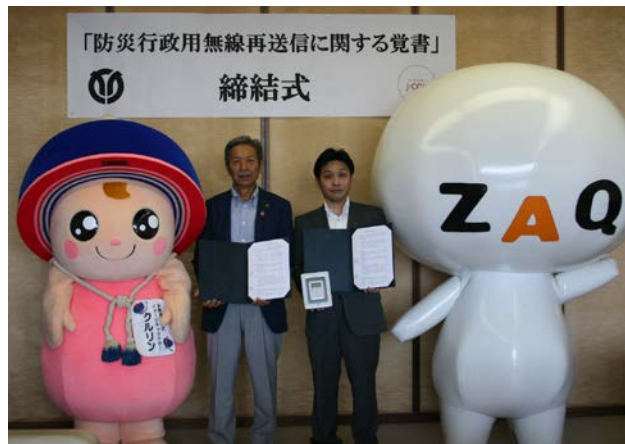
<2014年8月7日 締結式の様子>

伊勢原市の防災行政用無線の告知放送を「J:COM防災情報サービス」で配信することは、ジェイコムイースト 秦野・伊勢原局と伊勢原市が8月7日に覚書を締結し決定しました。