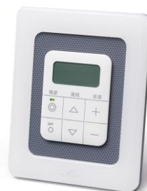
「防災情報サービス」端末

「防災情報サービス」は、気象庁が発報する緊急地震速報と自治体が配信する防災行政無線の放送内容を専用端末により提供するサービスです。また、この端末にはFMラジオが搭載されており、災害時には持ち出してFMラジオを受信することもできます。