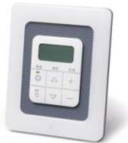
J:COM 防災情報サービス 端末