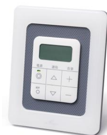
「防災情報サービス」端末