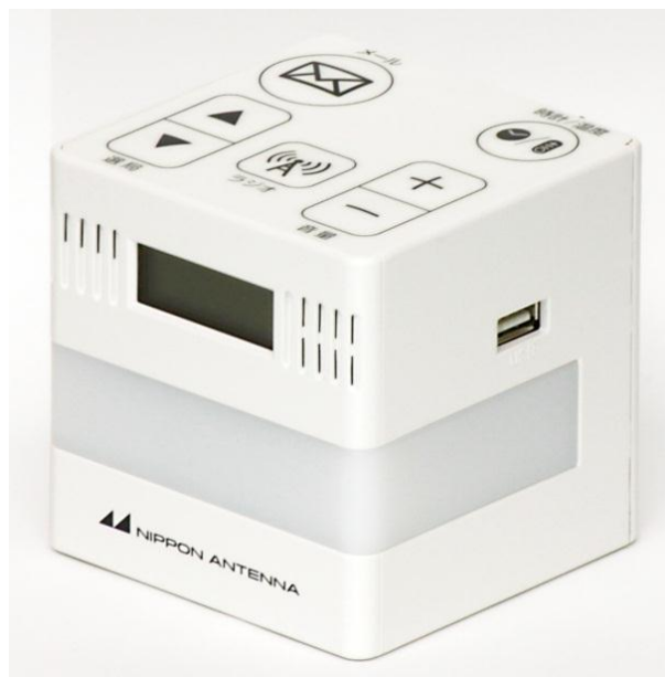
J:COM の「防災情報サービス」専用端末

J:COM 市川は今後も、地域の安全・安心なまちづくりにさらに貢献していきます。